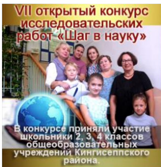
Участие в VII открытом конкурсе исследовательских работ «Шаг в науку»