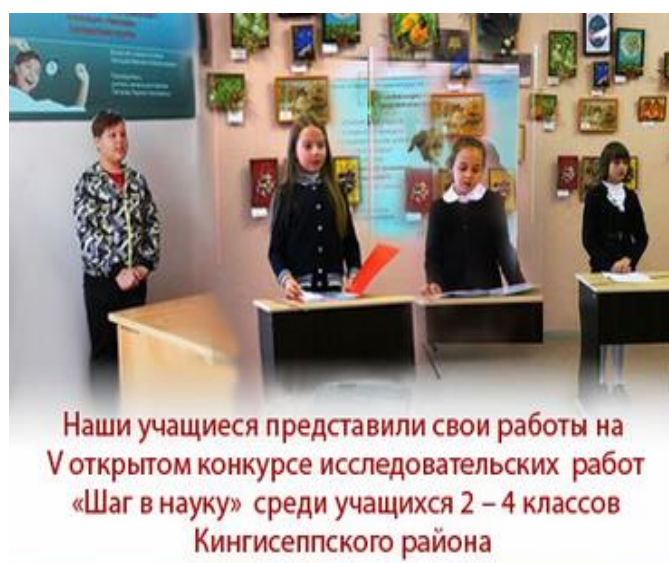
V открытый конкурс исследовательских работ «Шаг в науку»